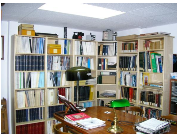
Un racó de la biblioteca al nou local