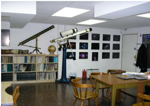
La sala principal del nou local i el vell telescopi que ocupava la cúpula