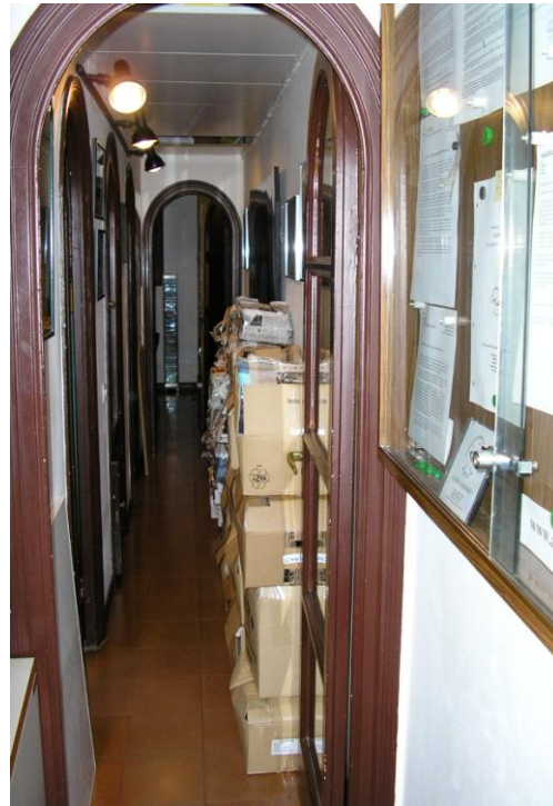
A dalt i costat: preparant el trasllat al vell local