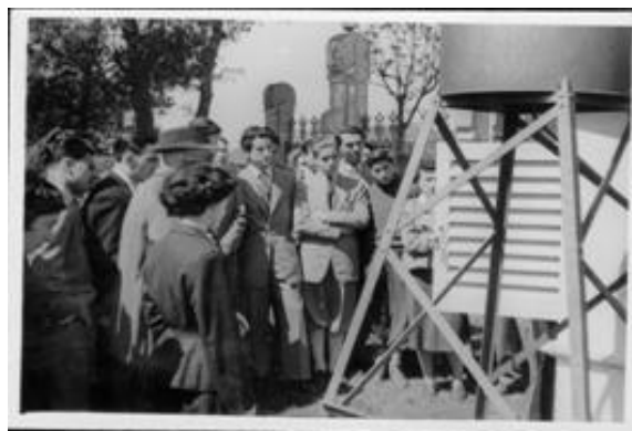
Visita al Observatorio Fabra y su estación metereológica (numerosa asistencia)

La veneración de Ernest por Comas i Solà le llevaron a organizar, creo que en el Palau Moja, una exposición de homenaje para la que obtuvo, de su viuda todas las facilidades y objetos.