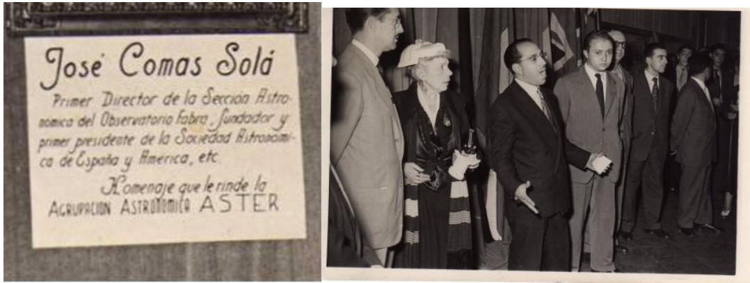
La inauguración con la viuda de Comas i Solà